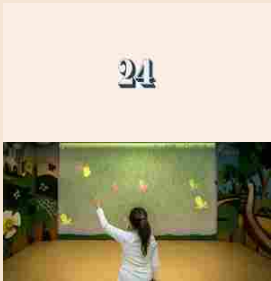
1° | Medici robot / La teleriabilitazione di CARELab