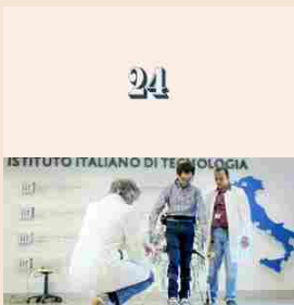
4° | Medici robot / L'esoscheletro robotico