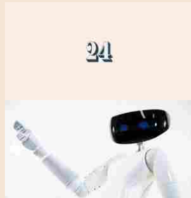
2° | Medici robot / Il robot umanoide R1