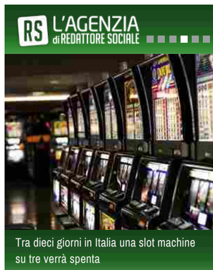
Tra dieci giorni in Italia una slot machine su tre verrà spenta