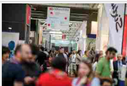
Robot umani per allenare i medici. A Exposanità le cure del futuro sono già arrivate

ROMA – Un robot che urla dal dolore (e sanguina davvero) per insegnare ai medici a non sbagliare le manovre sui pazienti. Un contenitore speciale che riesce a tenere in vita un rene molto più a lungo dei tempi standard e dà più chance ai trapianti. Ma anche un satellitare che guida il chirurgo e lo aiuta nelle difficili operazioni di neurochirurgia, ad esempio fare biopsie mirate durante un intervento al cervello. Sono alcune delle più straordinarie innovazioni in campo medico presentate in questi giorni a