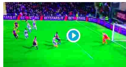
Simy come Cristiano Ronaldo: video gol rovesciata in Crotone-Juventus 1-1