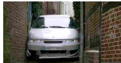
Genova, turista tedesco segue il navigatore e... resta incastrato nei vicoli del centro storico FOTO

La neuronavigazione può essere utilizzata “per qualsiasi tipo di intervento“, spiega ancora Tomei, ad esempio negli “approcci mini-invasivi” di chirurgia sulla spina dorsale, per applicare impianti o protesi. Per interventi chirurgici sul cranio, invece, la tecnologia satellitare può aiutare a fare biopsie mirate, evitando il più possibile danni collaterali. Tra le altre cose, sottolinea il presidente Aico, la neuronavigazione in sala operatoria permette di eliminare, o quantomeno ridurre, il ricorso alle radiazioni ionizzanti, abbassando così eventuali rischi sia per i