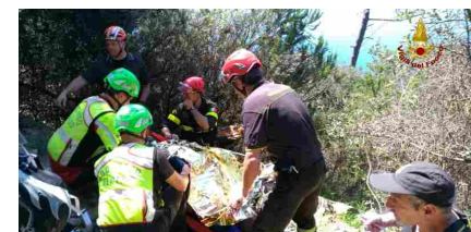
Soccorso sul sentiero Corniglia-Vernazza