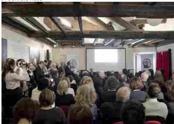
La conferenza stampa di presentazione

‘Cosmofarma Exhibition’, la manifestazione di riferimento del mondo della farmacia sarà a Bologna dal 20 al 22 aprile 2018 con il patrocinio di Federfarma e in collaborazione con il Gruppo Cosmetici in Farmacia di Cosmetica Italia.