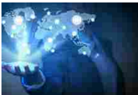
AkInnovation: ecco Otto, il sistema pensato per le imprese