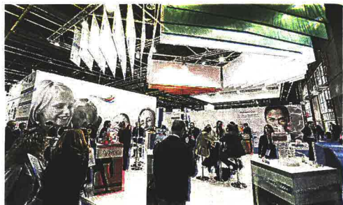
Bologna diventa capitale della Salute: Cosmofarma va a braccetto quest'anno con Exposanita , una staffetta settimanale dello starbene