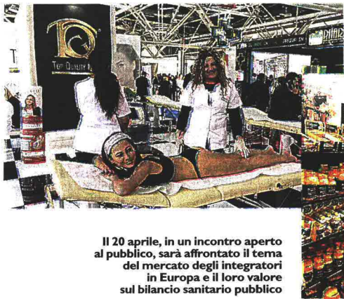
Il 20 aprile, in un incontro aperto al pubblico, sarà affrontato il tema del mercato degli integratori in Europa e il loro valore sul bilancio sanitario pubblico