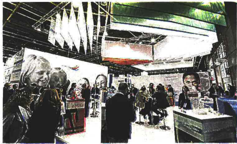
Bologna diventa capitale della Salute: Cosmofarma va a braccetto quest'anno con Exposanità , una staffetta settimana dello starbene