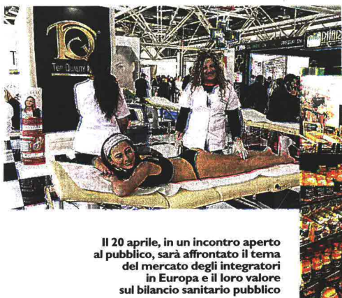
Il 20 aprile, in un incontro aperto al pubblico, sarà affrontato il tema del mercato degli integratori in Europa e il loro valore sul bilancio sanitario pubblico