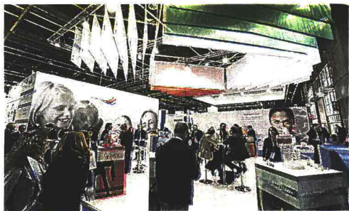
Bologna diventa capitale della Salute: Cosmofarma va a braccetto quest'anno con Exposanità , una staffetta settimana dello starbene