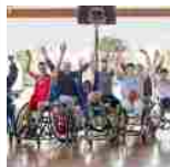
La prima edizione del Disabili Abili

Articoli correlati elaborati dal plugin Yet Another Related Posts.