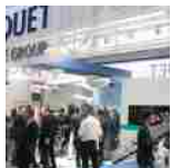
Exposanita 2016 tutte le