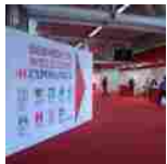
Exposanita: Dal 18 al 21 aprile a