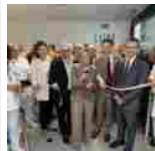
Doppia inaugurazione a