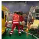
Cri apre centro formazione per