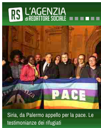
Siria, da Palermo appello per la pace. Le testimonianze dei rifugiati