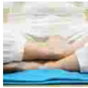
I consigli per tornare in