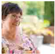
Assistenza agli anziani, nuova