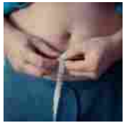
L'Obesity Day promuove