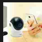
Massima sicurezza domestica e commerciale con le nuove telecamere IP Extel