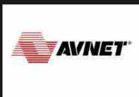
Avnet è "Distributore RSA dell'anno per i paesi EMEA"